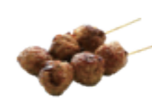
72 Boulettes de poulet