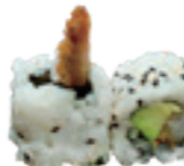
51 California tempura avocat