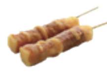
74 Bœuf au fromage