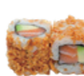
52 Frit roll avocat, saumon, oignon frit